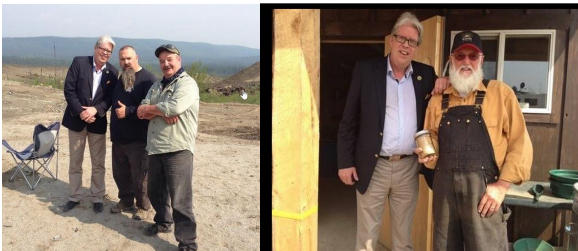
Fra sommerens besøk på film-set (produksjonen) til Hoffmann.

Her fra min «audiens» på deres TV sett i sommer – de jobber med Discovery Channel og sendes daglig i Norge og over 100 andre land.