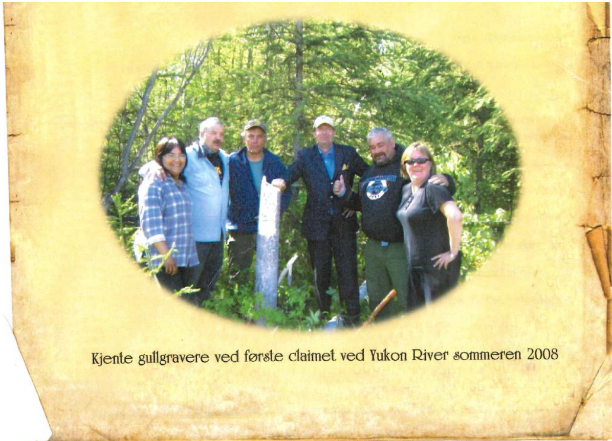
Kjente gullgravere ved første claimet ved Yukon River sommeren 2008